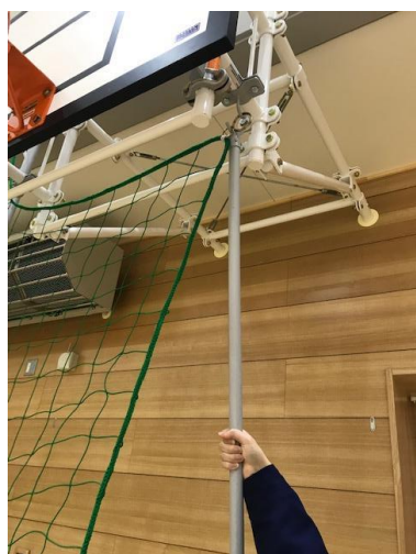
a.金具を引っかける

しまうときは、キャットウォークについているロープでネットを結び、ロープごと引き上げて、キャットウォークに戻してください。