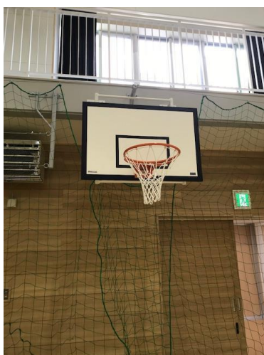
b.両側とも引っかける